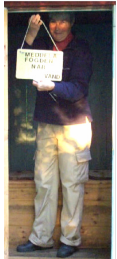
När du Melkers tunna fyllt, säg till fogden enligt skylt!

familj i Yttre Mongoliet, men det är en helt annan historia.