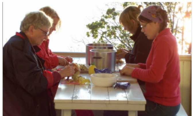
Dessa sköna damer fyra börjat middagen bestyra