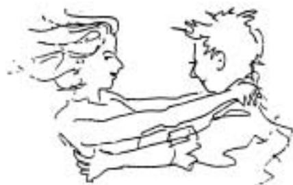
Illustration: Hans Vestin

Såväl nya medlemmar som nygamla och trogna dansentusiaster hälsas hjärtligt välkomna till en ny danstermin, då vi lär något nytt, friskar upp gamla kunskaper och framför allt har trevligt tillsammans. Vi börjar kl. 19 och slutar kl. 21, som förr traditionsenligt på torsdagar.