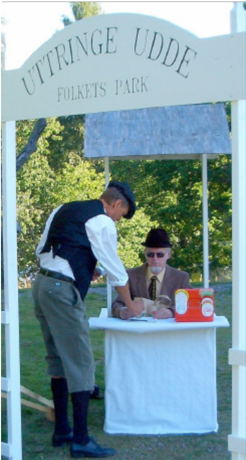
Det kan inte lätt förstås hur han äntrade sitt bås

Uttringe badade i strålände sensommarsol när Uttringe Udde Folkpark slog upp sina portar. Vakten såg till att ingen passerade ingången utan att ha betalat och blivit avprickad på listan. Dagen till ära fick den gamla brunnen från ett tidigare upptåg agera biljettkur.