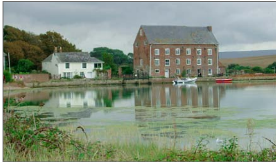
Högst där uppe fick man svindel särskilt om man såg en spindel.

är fantastiskt och väldigt intressant, vi bodde i två- eller tre-bäddsrum på våning 1 och 2. I bottenvåningen fanns ett kök där alla kunde sitta och äta,