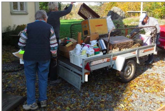
Ifrån vinden allsköns skräp slängdes upp på bilens släp.

Som vanligt började det fixas i olika hörn. Några av oss tog "gör-tag", som min pappa alltid sa, med röjningen av vinden. Rostiga sängbottnar baxades ner, attiraljer till Uttringestämmor sorterades, och mycket lades på flaket för att forslas till tippen. Det blev två lass och en luftigare vind! Ännu finns det saker kvar att slänga där uppe, men vi börjar se en ljusning.