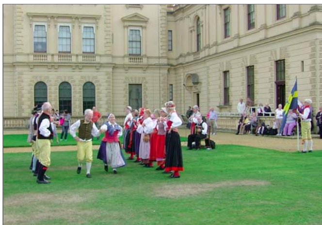
Denna dansplats den låg flott tätt intill ett kungligt slott.

Det fanns också ett mindre hus, Swiss Cottage, som byggdes åt kungabarnen, där prinsessorna fick lära sig att baka, laga mat och servera te inomhus, medan prinsarna fick tillverka och bygga saker utomhus.