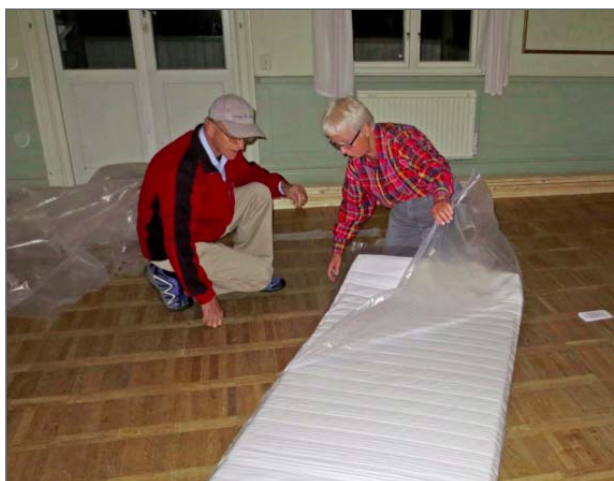
En madrass med rätta bredden packas upp till nya bädden.

Det röjdes och eldades sly samt en del av det vi hittade på vinden, som bl.a. de gamla sängfötterna av trä. Jag minns när vi var så många som sov över att vi fick lov att bära ner sängbottnar och -fötter från vinden!