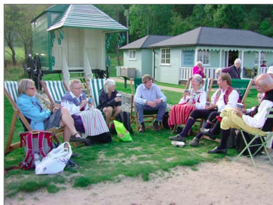
Bakom dem ser man en fin och rent kunglig badmaskin.

Vi som har haft sömlösa nätter för att anteckna var