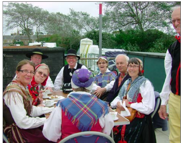
Nu, när klockan slagit tre bjöds på eftermiddagste.